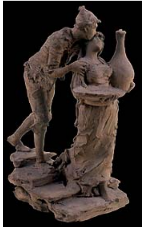
5. C. Barbella. Bacio galante , firmato. Gruppo plastico in terracotta (bozzetto). Chieti, Museo d'Arte C. Barbella.

Le sue sculture... sintomatiche di una stagione culturale in cui la storia locale diventa ispiratrice, in modi e con risultati diversi, di molti nostri artisti (Cusatelli), i contadini ed i pastorelli realizzati con cura, le coppie di giovani innamorati ed i ritratti plasmati con grande acume e freschezza, rivelano una felicità descrittiva spontanea e spiegano la popolarità di questo versatile artista, interprete del «verismo illusorio» e del «realismo romantico», aspetti individuati a suo tempo dagli studiosi Arturo Lancellotti e Fortunato Bellonzi che gli consentirono un facile successo a livello internazionale.