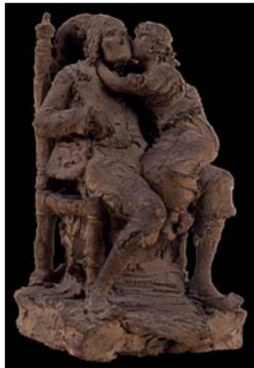
11. C. Barbella. Onomastico del nonno . Bozzetto. Chieti, Museo d'Arte C. Barbella.