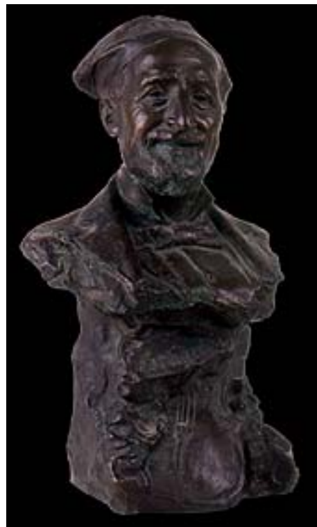
6. C. Barbella. Il Maestro Braga , firmato e datato 1919. Busto bronzeo. Chieti, Museo d'Arte C. Barbella.