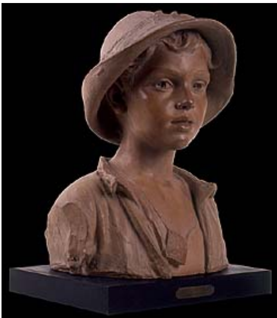
2. C. Barbella. Montagnolo . Busto ritratto in terracotta. Chieti, Museo d'Arte C. Barbella. Al collo del fanciullo è il «breo», la piccola tasca con le erbe scaramantiche che le madri delle montagne abruzzesi solevano appendere al collo dei figli.

A questo triste periodo risale il gruppo bronzeo Luce nelle tenebre , presentato nel 1920 all'Esposizione Internazionale della Società Amatori e Cultori di Belle Arti di Roma, oggi conservato nella Galleria Nazionale d'Arte Moderna della città, la cui versione in terracotta è invece presso il Museo chietino a lui intitolato. Morì cinque anni dopo, quasi cieco, nella casa della figlia Bianca dove viveva, accudito premurosamente anche dal genero, il barone Franco Cauli di Casalanguida.