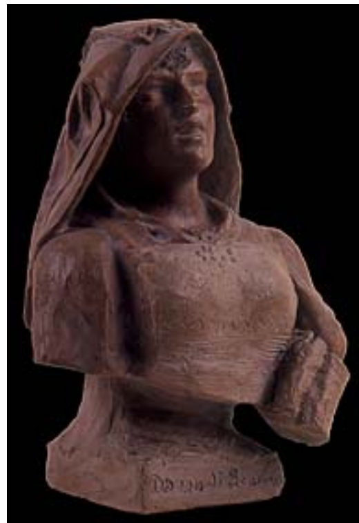
1. C. Barbella. Donna di Scanno , 1875. Busto ritratto in terracotta. Chieti, Museo d'Arte C. Barbella. La misura molto ridotta di questo busto ed il suo soggetto hanno fatto giustamente mettere in relazione questa figurina di genere con la pratica artigianale assai diffusa nel napoletano della produzione delle figurine per il Presepe, cui, come è noto, si dedicò anche la famiglia di Filippo Palizzi (Carlo Cusatelli).