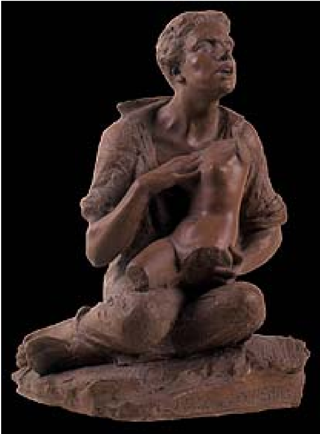
3. C. Barbella. Luce nelle tenebre , firmato. Terracotta. Chieti, Museo d'Arte C. Barbella. Da questa piccola, significativa opera plastica si intuisce il dramma intimo dell'autore, la triste consapevolezza che ormai poteva percepire solo con il tatto quello che stava creando. Traspone da essa il doloroso rimpianto di un mondo perduto, tradotto con il toccante contrasto tra la ruvida superficie dell'argilla sbazzata di quel ragazzo implorante e la forma femminile levigata, seppure monca ed incompleta, che avvicina al petto.