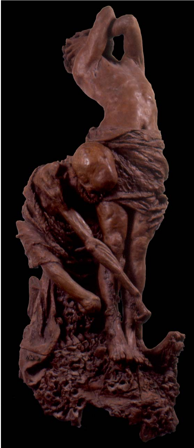
4. C. Barbella. La Morte , 1875. Gruppo plastico in terracotta (bozzetto). Chieti, Museo d'Arte C. Barbella. L'idea del trapasso è evocata dall'unità delle due figure: quella viva, eretta e sofferente e quella della morte, scheletro accasciato e al tempo forte nella stretta della mano sinistra, solcando le carni, la bocca dischiusa quasi a rodere (Cusatelli).

La notorietà ed il denaro giunsero con una piccola composizione, Canto d'amore , presentata nel 1877 all'Esposizione Nazionale di Belle Arti di Napoli ed acquistata dal Conte Gigliani, opera che gli procurò anche il riconoscimento in ambito accademico con la nomina di professore onorario dell'Istituto Reale di Belle Arti. Gli anni successivi videro la sua affermazione nell'ambiente inter-nazionale: nel 1879 partecipò infatti sia alla Esposizione Nazionale di Napoli sia a quella Internazionale di Parigi dove vinse il secondo premio. Il 1880 fu quindi l'anno della IV Esposizione di Belle Arti di Torino e del XCVII Salon di Belle Arti della "Società degli artisti francesi", dove si recò sempre insieme a Michetti.